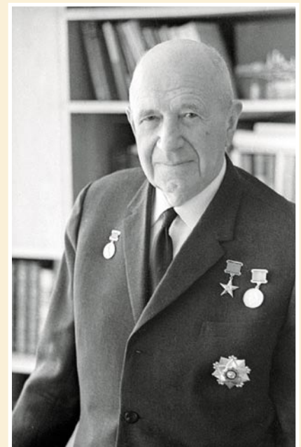
Рис. 1. Тареев Евгений Михайлович.

По окончании обучения в университете Евгений Михайлович начал работать участковым врачом при хамовническом комиссариате, а с апреля 1918 г. стал ординатором Госпитальной терапевтической клиники (и одновременно вторым санитарным врачом клиник) 1 МГУ. В 1919 г. был призван в армию и направлен главным врачом госпиталя в Уфу; вскоре заболел тифом и в 1920 г. был демобилизован. В 1920–1923 гг. работал, по направлению, врачом на постройке железных дорог в Чувашии.