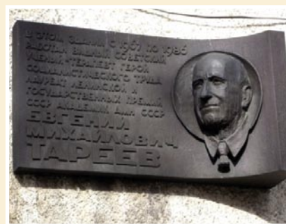
Рис. 2. Мемориальная доска на здании клиники нефрологии, внутренних и профессиональных заболеваний им. Е.М. Тареева.

Профессор Тареев Е.М. автор более 700 научных работ, из них 10 монографий, среди них широко известны: «Гипертоническая болезнь» (1948), «Нефриты» (1958) (Рис. 3), «Коллагенозы» (1965). Учебник Тареева «Внутренние болезни», впервые изданный в 1951 г. и переизданный в 1956 и 1957 гг., был основным учебником медицинских институтов в СССР и за рубежом. Основные научные труды академика Тареева Е.М. по проблемам патологии почек, печени, ревматических заболеваний, гипертонической болезни,