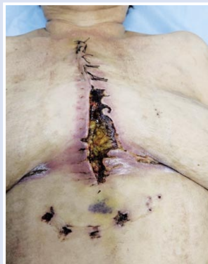
Рис. 1. Ранний послеоперационный стерномедиастинит с расхождением кожной раны (7-е сутки после операции).