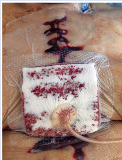
Рис. 7. Осложнение вакуум-терапии – аррозивное кровотечение под фиксированное плечное покрытие.