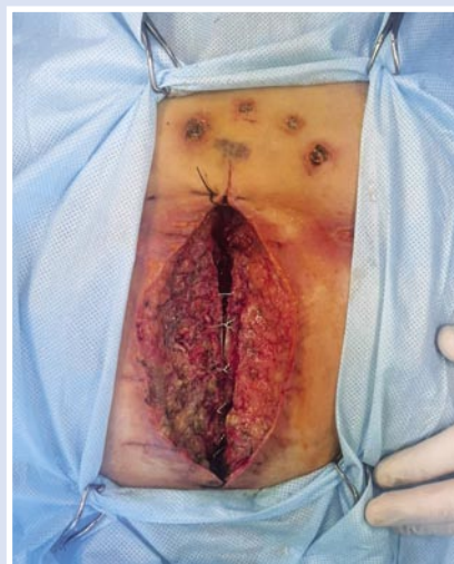
Рис. 3. Состояние раны после вскрытия гнойника (60 мл) в переднем средостении, радикальной хирургической обработки с сохранением проволочных швов (I фаза течения раневого процесса).