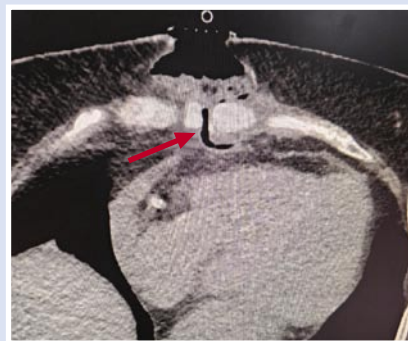
Рис. 2. КТ грудины: несостоятельность остеосинтеза, признаки остеомиелита.