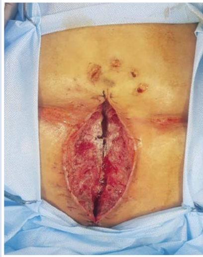
Рис. 6. Вид раны после снятия вакуумной системы на 6-е сутки.