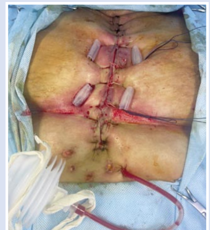
Рис. 10. Вторичная хирургическая обработка раны с демонтажем вакуумной повязки и наложением вторичных швов с серкляжным швом грудины.

рана велась с применением эпидермального фактора роста и сульфадиазина серебра (Рис. 8). С появлением грануляций в ране и отрицательных бактериологических посевов, была выполнена ее вторичная хирургическая обработка с частичным ушиванием и сохранением вакуумной повязки (Рис. 9). После полного купирования гнойного процесса и хорошего стимулирующего эффекта препарата «Эбермин», операционная рана вновь подвергнута вторичной хирургической обработке с наложением адаптационного серкляжного шва на грудину мононитью №2, закрытием раневого дефекта вторичными швами на резинках (Рис. 10).