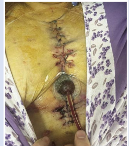
Рис. 9. Частичное ушивание стеральной раны с сохранением вакуумной повязки.

особенности течения стерномедиастинита с нестабильностью грудины, решено ведение раны осуществлять открыто с использованием вакуумной повязки (Рис. 4) с разрежением 70 мм рт. ст. Вакуумную терапию проводили в течение 12 суток. Выполнено четыре смены VAC-системы (Рис. 5, 6) с удалением раневого экссудата объемом до 300 мл/сутки. После третьей замены VAC-системы возникло осложнение – аррозивное кровотечение (Рис. 7), которое потребовало демонтажа VAC-системы и выполнения тщательного гемостаза. В дальнейшем