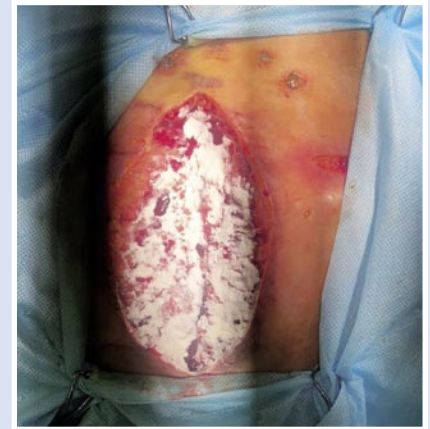
Рис. 8. Обработка гранулирующей стеральной раны мазью «Эбермин».