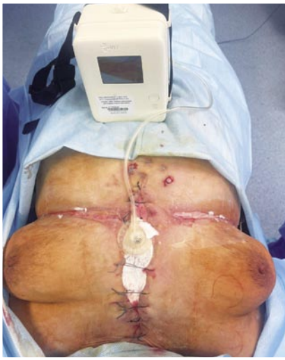
Рис. 4. Вакуумная система, наложенная на рану после хирургической обработки (постоянное отрицательное давление – 80 мм рт. ст.).