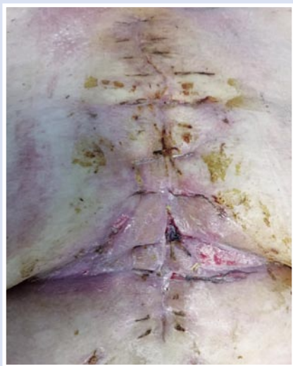
Рис. 11. Окончательный вид раны после снятия вторичных швов (18-е сутки лечения).

Послеоперационный период протекал без осложнений, заживление раны – первичным натяжением (Рис. 11). На 30-е сутки больная была выписана из стационара. На контрольной КТ грудной клетки отмечено полное сопоставление грудины, отсутствие признаков воспалительного процесса и скопления экссудата (Рис. 12).